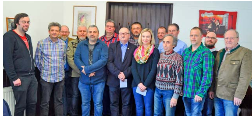
Freude bei der Spendenübergabe durch den Vorstand an die Einrichtungen zur Unterstützung der Jugendarbeit im Rahser

Kontaktadresse: Förderverein WIRvomRAHSER e.V. info@wir-vom-rahser.de mobil: 0172-1703737