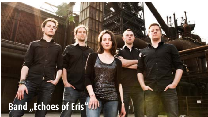
Band „Echoes of Eris“

dem handlungsunfähigen Selbst, nach langem Erdul- den endlich lautstark formu- liert durch hämmernde Gi- tarrtenwände, Double-Bass- Salven und eine kräftige Stimme. Doch auch die lei- sen Zweifel an den eigenen Entscheidungen und deren Konsequenzen finden Platz in den sphärisch-düsteren Teilen der Songs. Im Som- mer 2018 beginnen die Auf- nahmen für das neue Album „Decay“ (Release Mai 2019). Sie werden dabei durch ei- nen create music NRW un- terstützt.