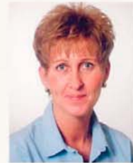
Doris Zazzi Haushalts- und Betreuungsservice