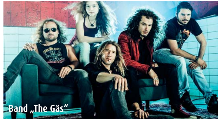
Band „The Gäs“